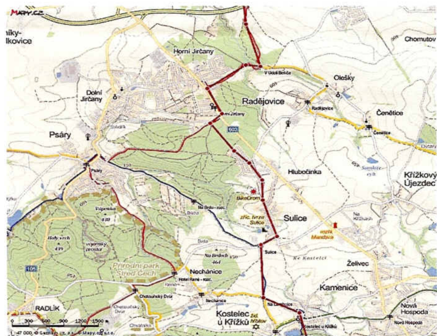
Radějovice – Kostelec u Křížku