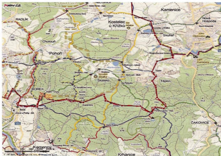
Kostelec u Křížků – Těpín, Gryblá, Borek, Kabáty