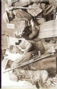
Een Frans paar bedankt Amerikaanse soldaten die hun stad op 6 november 1918 bevrijdden.