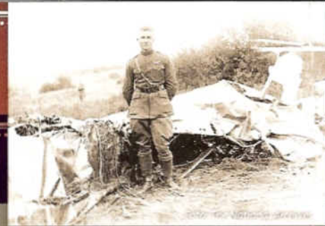
Tweede Luitenant Frank Luke, Jr. schoot 18 Duitse vliegtuigen en ballonnen neer in 17 dagen.

VERKLARING: † Militaire begraafplaats 🗿 Monument