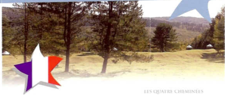
LES QUATRE CHEMINÉES

En 1916, l'Allemagne s'inquiète de l'accroissement des forces alliées. Redoutant une vaste offensive, elle doit garder l'initiative des opérations sur le terrain en impressionnant l'opinion mondiale. Une grande victoire est donc indispensable pour redorer le prestige de la dynastie impériale et pour imposer des pourparlers de paix à la France.