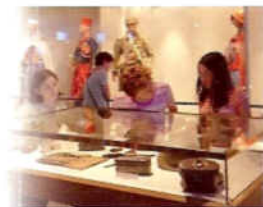
LE MEMORIAL DE VERDUN

La bataille de Verdun a laissé des traces profondes dans la mémoire, l'identité locale mais également dans le paysage. La « zone rouge », cœur du conflit, conserve aujourd'hui les stigmates de cette bataille.