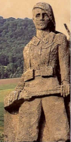
Sicht auf den Wald von Le Mont-Dieu.