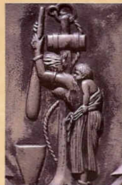
Harvesting of cereal from senegal. Senegalesische Hirseerstermpferin.