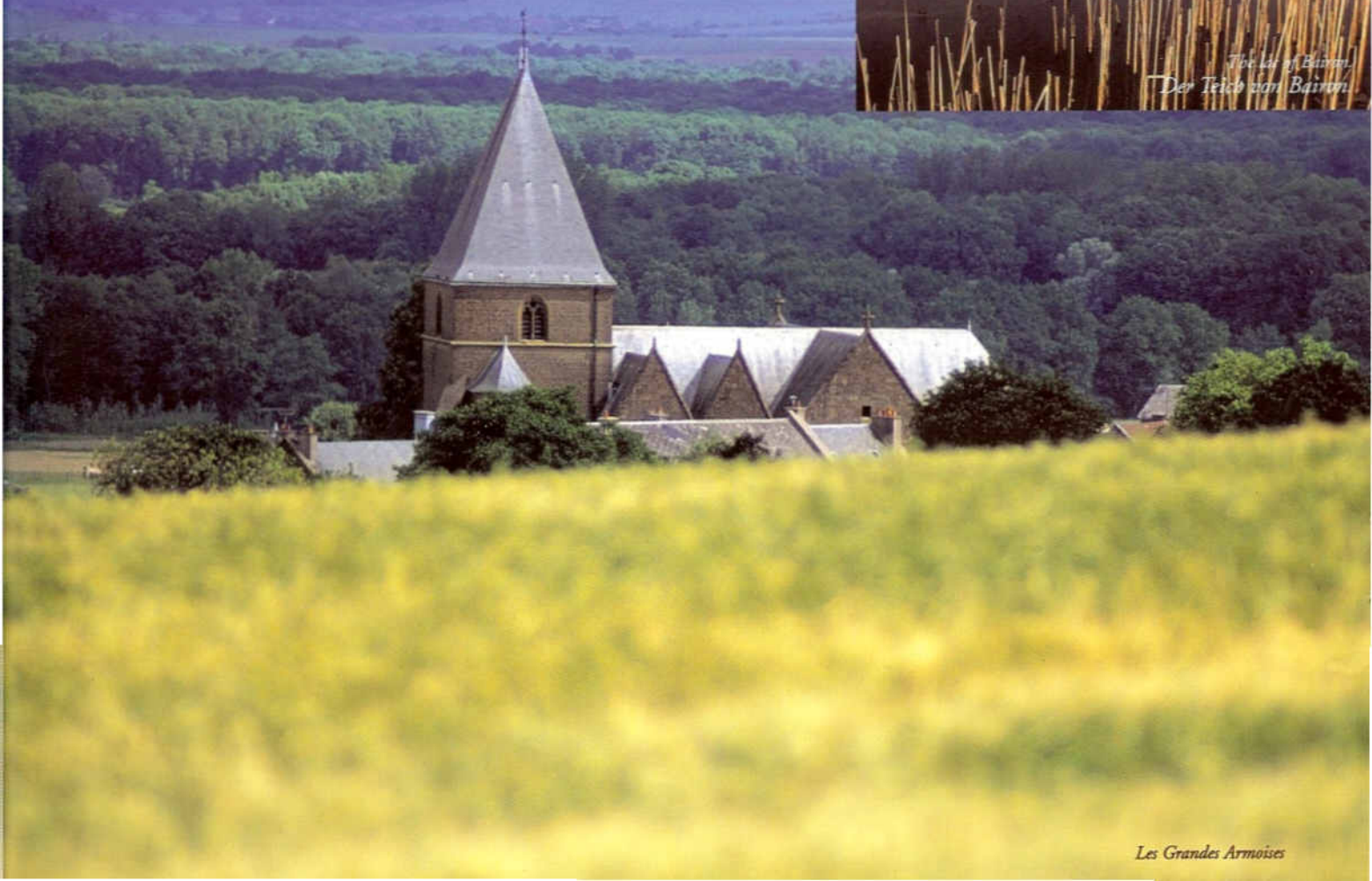
Les Grandes Armoises