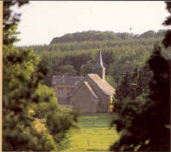
Les Grandes Armoises