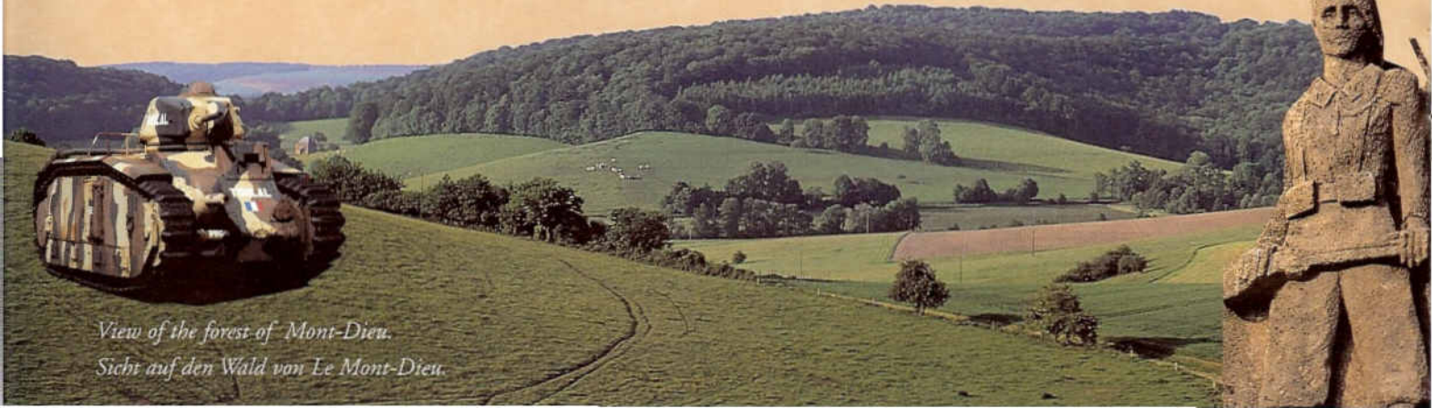
View of the forest of Mont-Dieu.

Detail vom Gedenkstein 16. Jägerbataillon